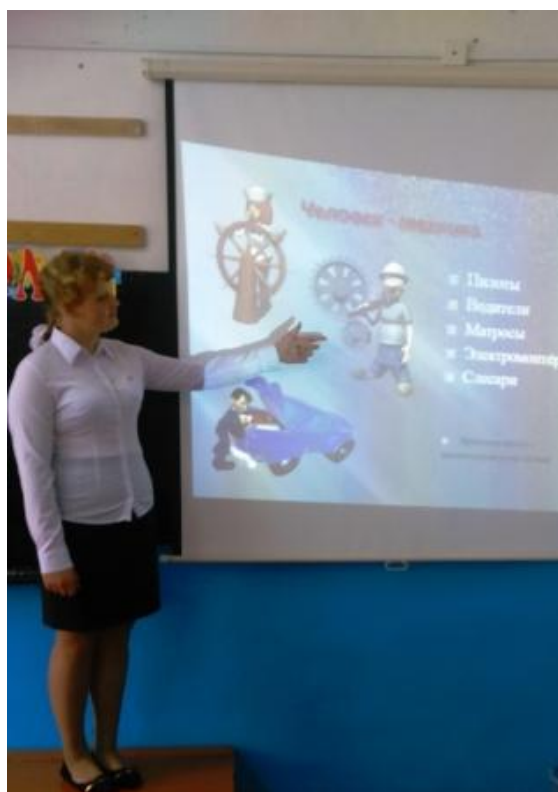
Ученица соотносит запись с иллюстрацией