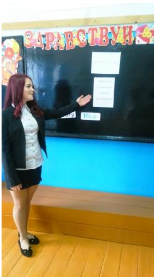
Ученица объясняет, что такое профессия