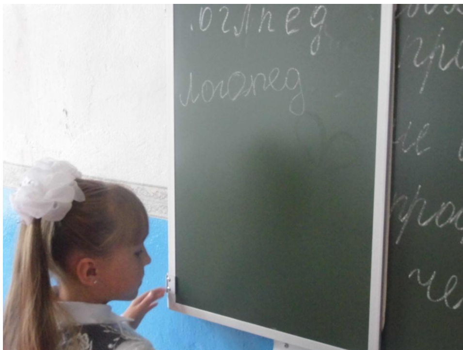
Классный час в 3 классе на тему «Все профессии важны»