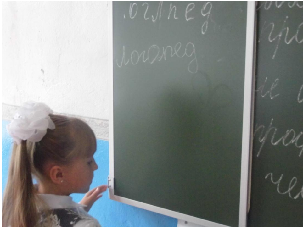
Классный час в 3 классе на тему «Все профессии важны»