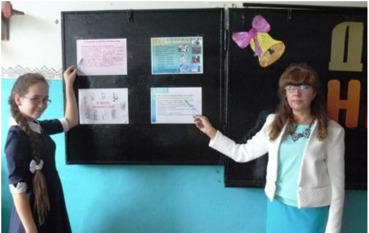
Урок - игра в 6, 7 классе на тему «Азбука при выборе профессии»