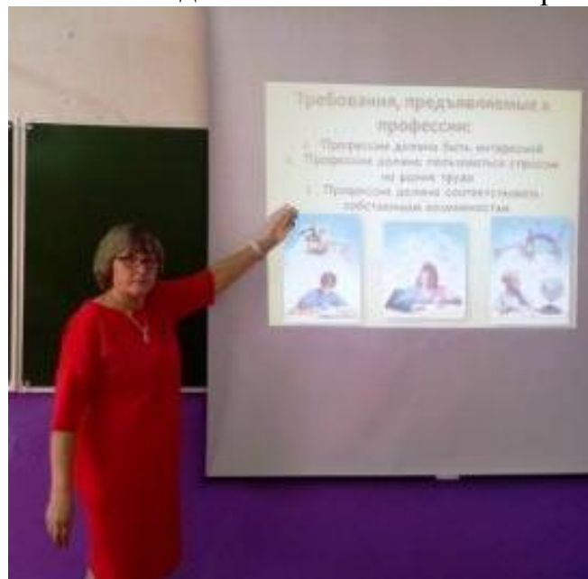
Классный час в 9 классе